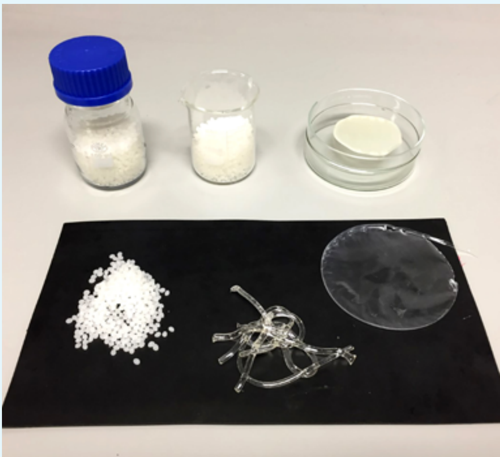
Muestras de bioplásticos desarrollados en los laboratorios del Centro Tecnológico Idonial

El objetivo del proyecto persigue desarrollar nuevos materiales adecuados para ser utilizados como materiales de envasado mediante el estudio del procesado de estos biopolímeros obtenidos a partir