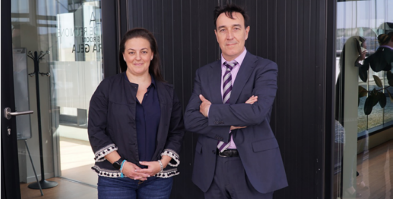
Los responsable de CIC energigUNE y Cidetec posan en la entrada del CIC del Parque de Álava

CIC energigUNE se integra en BatteRIes Europe, la plataforma que coordinará toda la investigación en baterías a nivel europeo