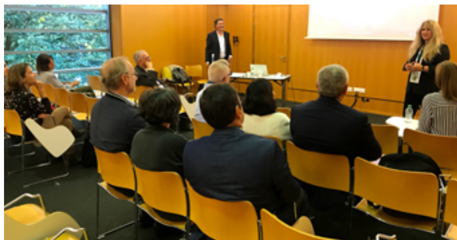
Reunión de APTE con Tecparques durante la 36 Conferencia Mundial de IASP

En esta ocasión, la conferencia contó con una importante delegación española compuesta por 28 personas representantes de 14 parques científicos y tecnológicos, quienes aprovecharon la ocasión, entre otras cosas, para reunirse con los parques científicos y tecnológicos portugueses que asistieron al evento y a los que los une la Alianza Ibérica, un compromiso de colaboración que se inició hace ya más de 17 años y que este año se pretende afianzar aún más a través de acuerdos de hermanamiento entre los parques.