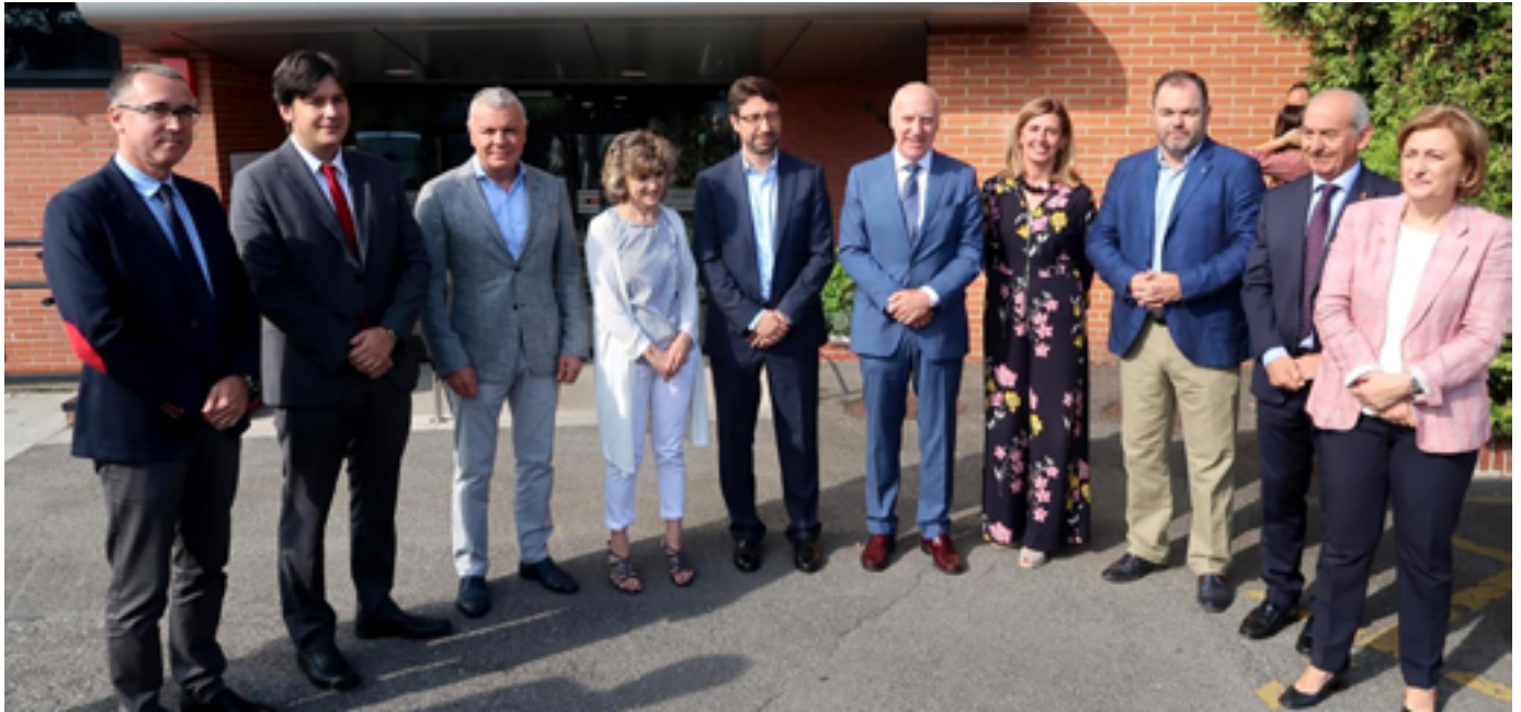
La ministra de Sanidad, Consumo y Bienestar Social acompañada de los consejeros de Industria, Empleo y Promoción Económica, de Ciencia, Innovación y Universidad y de Salud, la directora general del IDEPA, la delegada del Gobierno y representantes de organizaciones empresariales