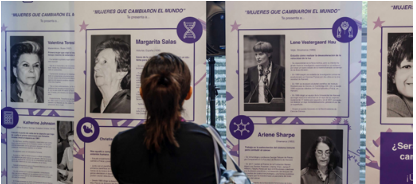
Inauguración de la exposición “Mujeres que cambiaron el mundo” en el Parque Científico de la UC3M, Leganés Tecnológico