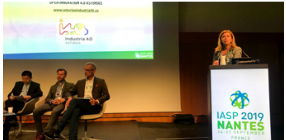
Eva Pando, directora general de IDEPA y presidenta del Parque Tecnológico de Asturias