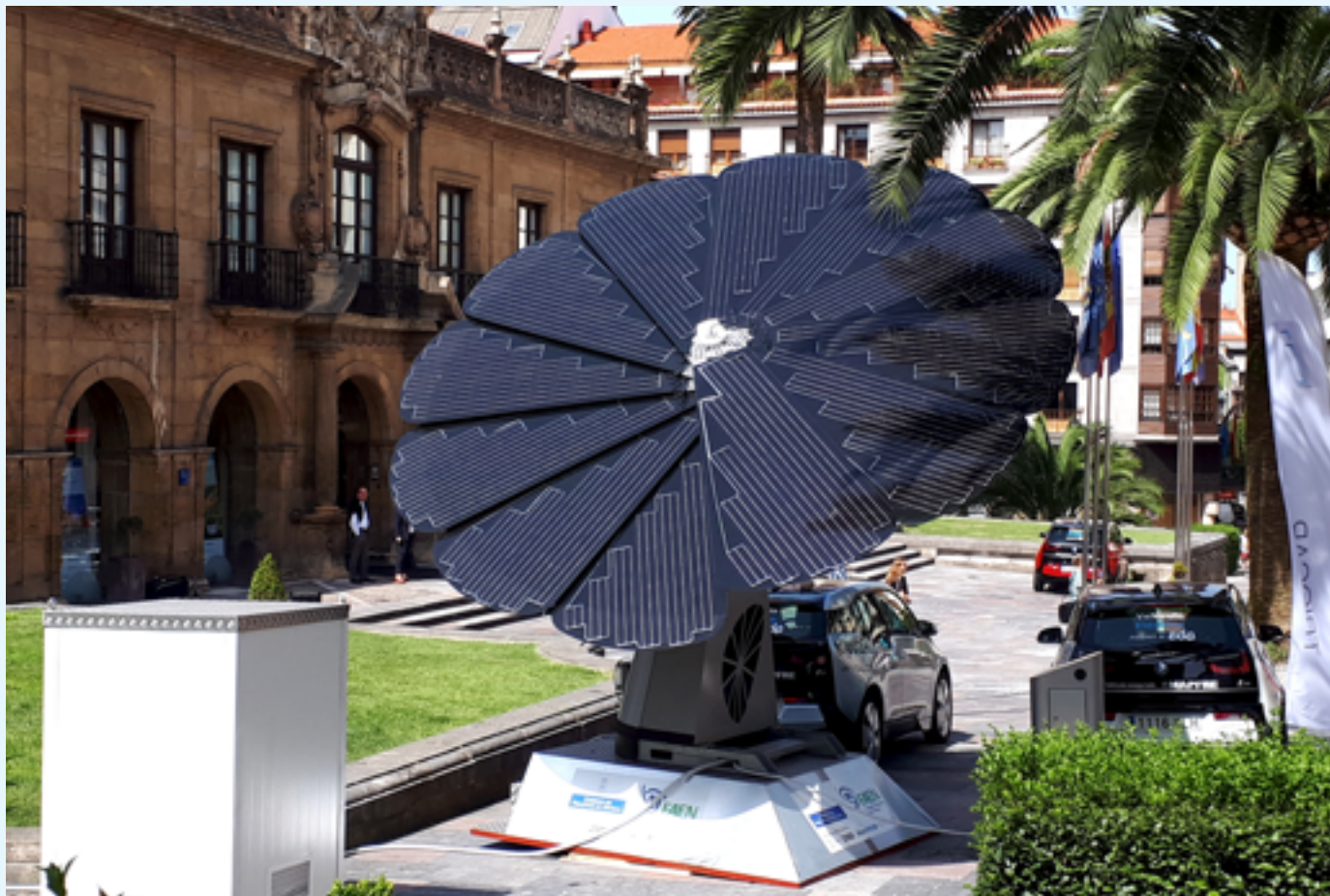
Vista de la estación móvil y autónoma para la recarga de vehículos eléctricos durante uno de los actos de demostración

Electricidad solar para vehículos automóviles (ESVA): la estación de recarga autónoma que permite cerrar el círculo de cero emisiones