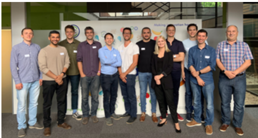
La responsable de EIT-Food junto a los participantes de la iniciativa en el Parque Científico y Tecnológico de Bizkaia

El semillero vizcaíno es uno de los tres abiertos este año, junto a otros dos en Polonia e Irlanda del Norte. Los integrantes de las start-up participantes, ya han sido recibidos y se encuentran inmersos en un programa intensivo que busca la viabilidad de sus proyectos