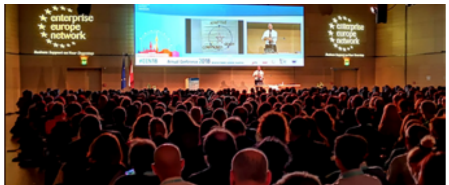
Conferencia anual de la Enterprise Europe Network (Viena), 2018

En 2018, en el marco de la Enterprise Europe Network, la Fundación Parque Científico de Madrid ha organizado