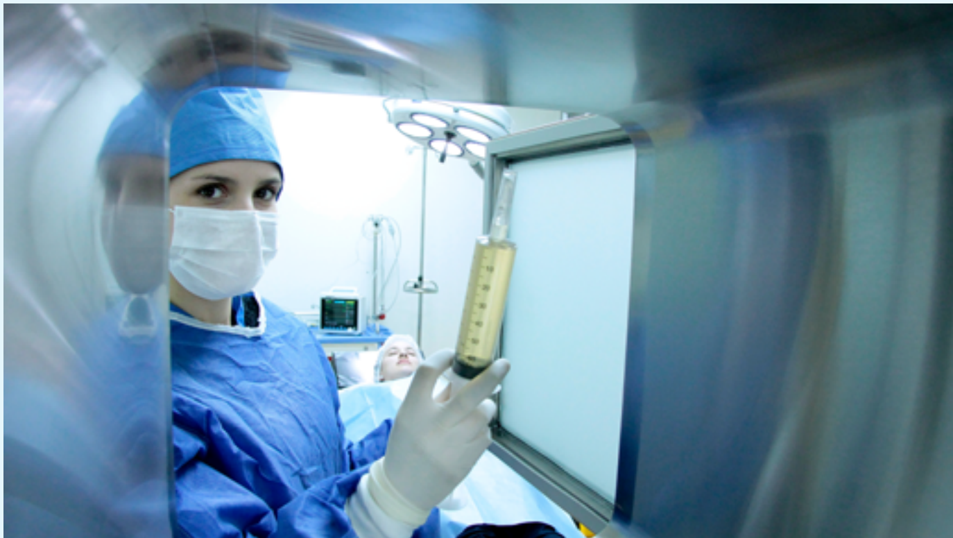
Instalaciones de CELLUS S.A del Edificio Marriott de Santiago de Chile