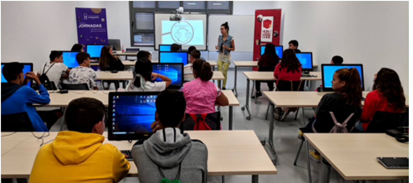
Estudiantes del IES Alvareda dan sus primeros pasos programando con Scratch en el Parque de I+D Dehesa de Valme

a talleres en los que se abordarán temáticas innovadoras como la robótica, las matemáticas védicas o la nanotecnología.