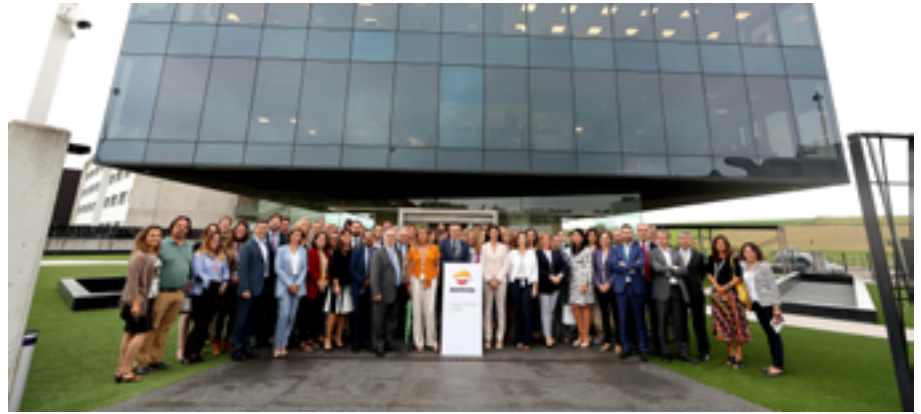
El edificio CiSGA, propiedad del Grupo Ambar, es el lugar elegido por Repsol Electricidad y Gas para instalar su nueva sede

El edificio CiSGA también va a tener otros usos, ya que en las plantas sub-