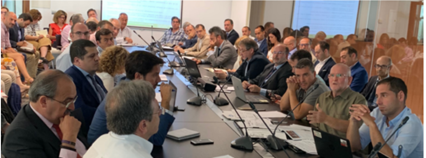
Sesión de trabajo del Plan Aeroespacial en Aerópolis

Los consejeros de Hacienda y Economía presentaron esta iniciativa que se centrará en la mejora de la competitividad, internacionalización, innovación y diversificación del sector