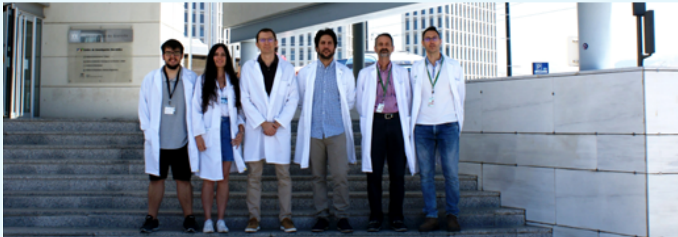
Integrantes del estudio en el Centro de Investigación Biomédica

Un estudio liderado por investigadores del Instituto de Nutrición y Tecnología de los Alimentos 'José Mataix', ubicado en el Centro de Investigación Biomédica del Parque Tecnológico de la Salud (PTS) de Granada, ha determinado que la ingesta prolongada de aceite de oliva virgen y, en menor medida, la de aceite de pescado, aumenta la esperanza de vida media en ratas alimentadas durante toda su vida con cualquiera de estos tipos de grasa frente al aceite de girasol.