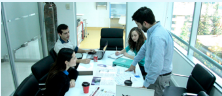
Instalaciones de CELLUS S.A del Edificio Marriott de Santiago de Chile

derivadas de tejido adiposo humano (ha-MSC) expandidas en un ambiente controlado de oxígeno sin utilizar productos derivados de animales (xeno free). Luego se agrega un número definido de estas células en una conformación 3D bajo hipoxia continua utilizando un proceso patentado controlado y escalable, obteniendo miles de Celluspheres® para múltiples pacientes potenciales o cultivo adicional en un biorreactor.