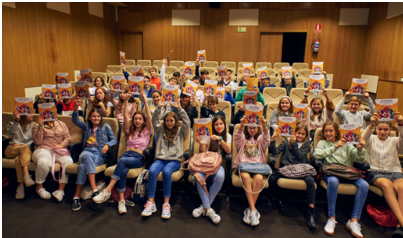
Estudiantes del Colegio Maristas de Ourense reciben la guía "¿Qué quiero ser de mayor?" en el Parque Tecnológico de Galicia - Tecnópole

La iniciativa Ciencia y Tecnología en femenino tiene como objetivo principal aumentar el porcentaje de alumnas que eligen disciplinas STEM en educación secundaria